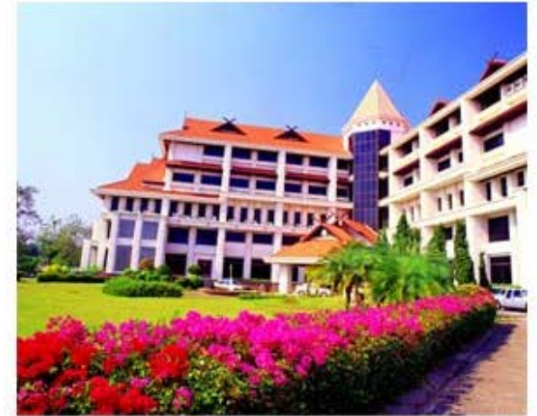
ห้องประชุม กุหลาบควีนสิริกิติส (ชั้น 5) อาคารศูนย์กล้วยไม้และไม้ดอกไม้ประดับ

สอบถามข้อมูลเพิ่มเติม | 053-872729, 081-9802250